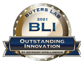
Xerox Adaptive CMYK+ Kits Outstanding Innovation in Production Print

Notre trousse Toners vifs offre quatre couleurs d'accompagnement spéciales : Or, Blanc, Argent et Transparent. Les Toners fluorescents de la Trousse Combinaison renforcent l'impact avec les coloris Cyan fluorescent, Magenta fluorescent et Jaune fluorescent.